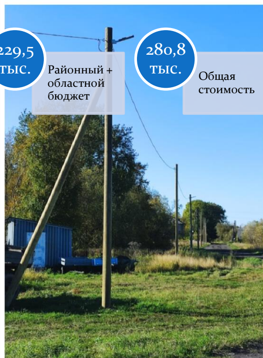
с. Вознесенье ТОС «Заря» Проект «Огни села!»