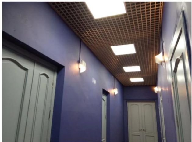
с. Вознесенье ТОС «Заречное» Проект «Да будет свет!»